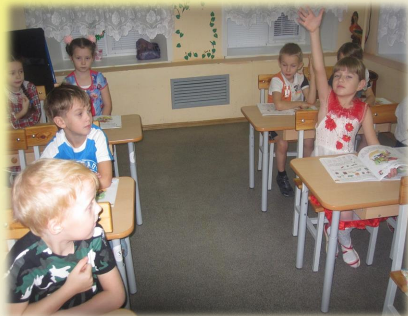
Звонок от Деда Мороза.