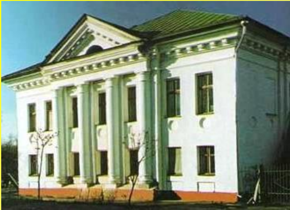
Муниципальное бюджетное дошкольное образовательное учреждение детский сад №2«Рябинка» г.Посехонье