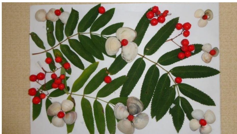
Панно «Рябинушка кудрявая»