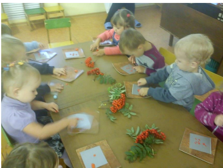
Целый день, целый день Заниматься нам не лень