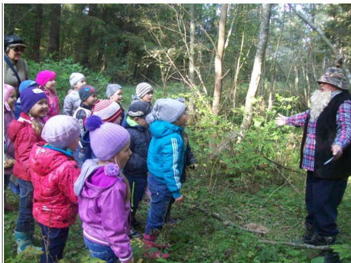
Встреча с Лесовичком