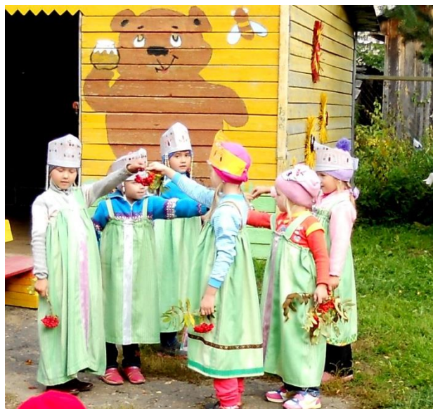
Хоровод «Ветка рябины»