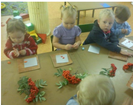
Лепка «Ягоды рябины»