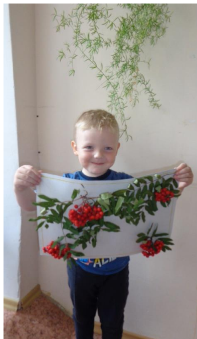
Поздравительная открытка из природного материала