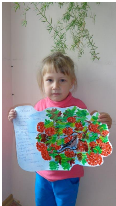
Рисование тычком «Ветка рябины»