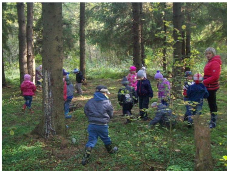
Сбор природного материала