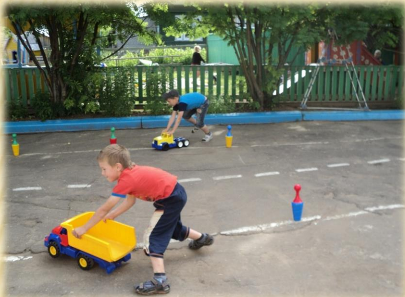
Игра «Автошкола» с детьми старшей группы