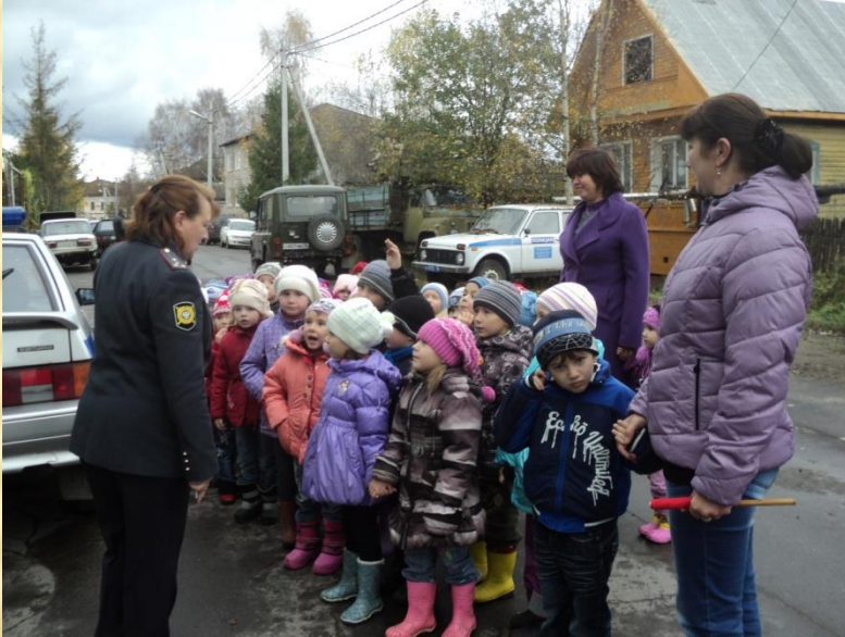
Экскурсия в ГИБДД