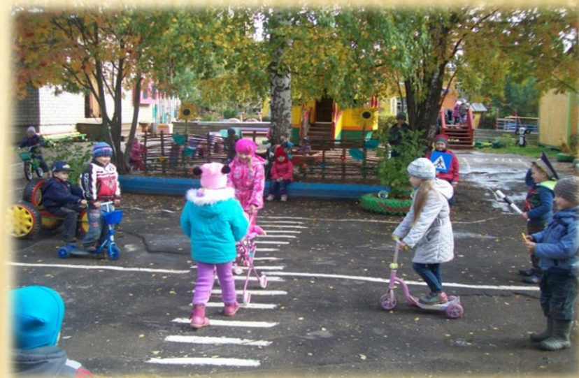
Сюжетно-ролевая игра «Инспектор ГИБДД»