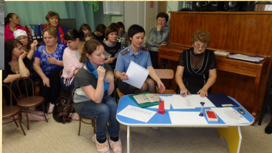
Родительское собрание с участием сотрудника ГИБДД