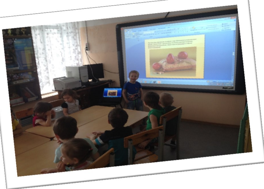
Образовательная деятельность с применением ИКТ технологии «Светлая Пасха»