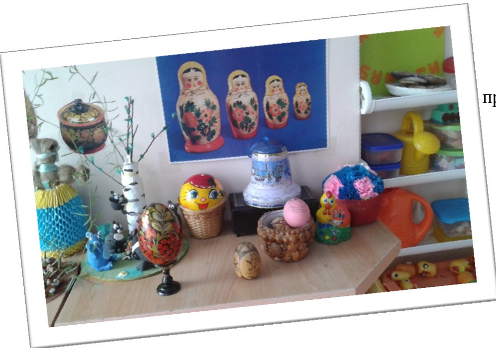
Оформление предметно-развивающей среды по теме «Светлая Пасха»