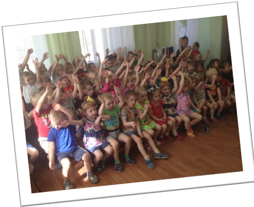
Показ кукольного спектакля с участием педагогов детского сада «Красная Шапочка»