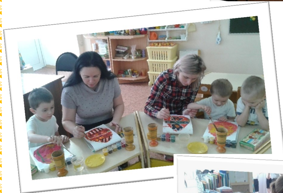
Творческая мастерская с родителями «Украшим пасхальное яйцо»