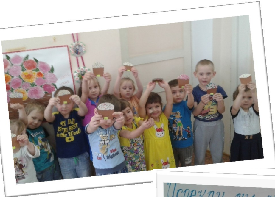
Лепка в технике пластилинография «Испекли мы куличи»