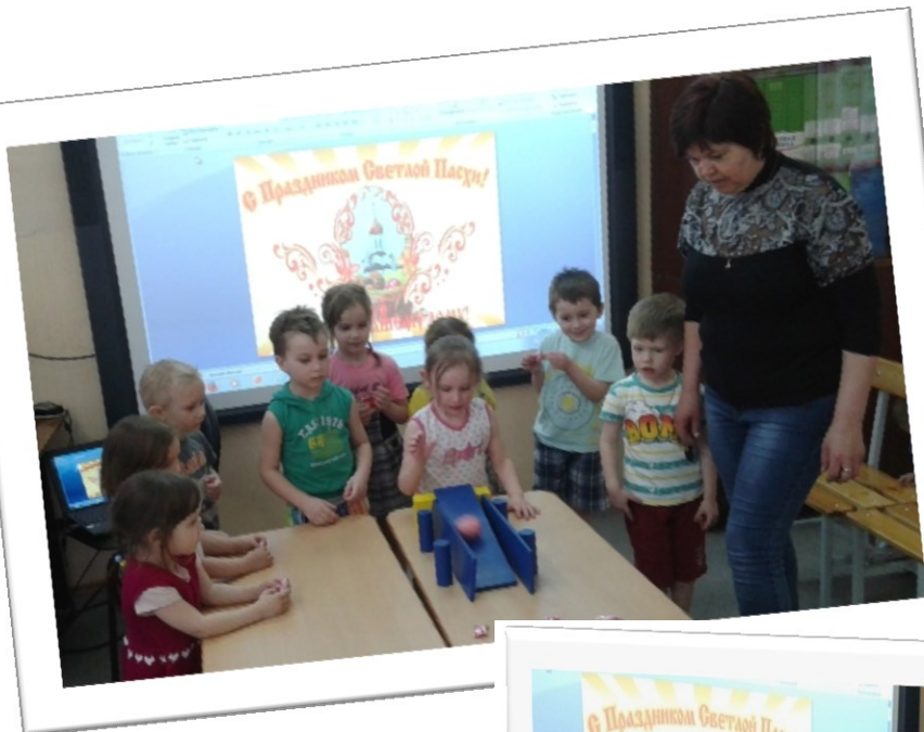
Пасхальная игра «Катание яиц», «Красная горка»