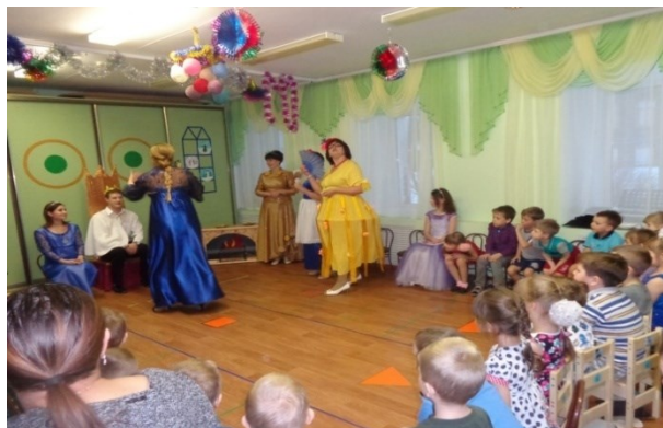
Сцена из интегративного спектакля «Золушка»

Ежегодно родители принимают активное участие в интегративных спектаклях, что дает возможность увидеть, как их дети ведут себя в той или иной ситуации, как реагируют на события, произошедшие с ними.