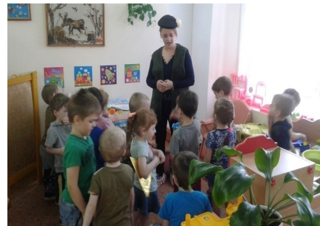
Квест-игра в средней группе «По щучьему велению»

Организация совместного интересного досуга детей и их родителей в форме квест – игры способствует сплочению коллектива участников, создает условия для выявления и развития личностных качеств, уверенности в себе и в партнере.