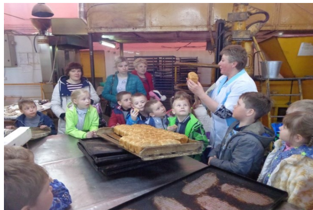
Экскурсия на хлебозавод, организованная родителями детей старшей группы.

В детском саду с родителями традиционно проводятся совместные прогулки и экскурсии, что позволяет увеличить непосредственное участие родителей в жизни детского сада и установлению партнерских отношений участников педагогического процесса.