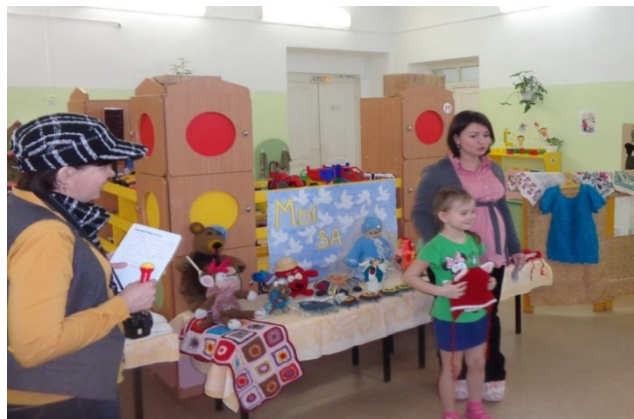
Мастер-класс в рамках проекта «К чему душа лежит, к тому и руки приложатся» (ст.гр.)

С целью изучения и распространения передового опыта семейного воспитания педагоги совместно с родителями организуют мастер-классы.