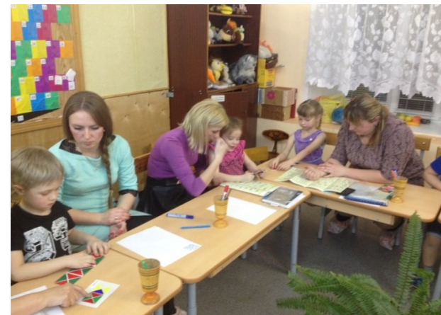
Заседание клуба «Маленькие гении»

Созданный детско-родительский клуб «Маленькие гении» ведет активную работу с семьями одаренных детей.