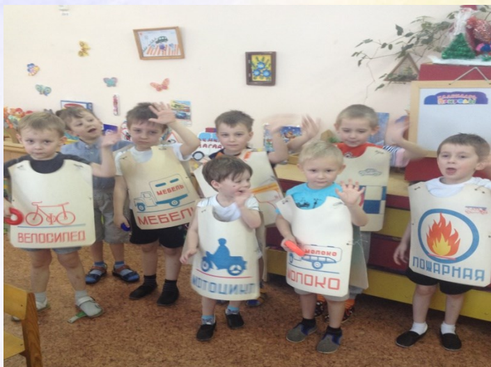
Сюжетно-ролевая игра «Автосервис»