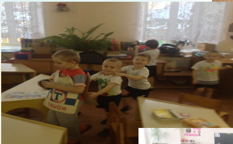
Сюжетно-ролевая игра «На дорогах города»