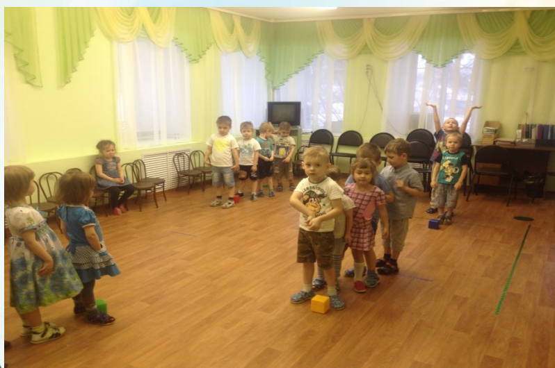
Подвижная игра «Будь внимателен»