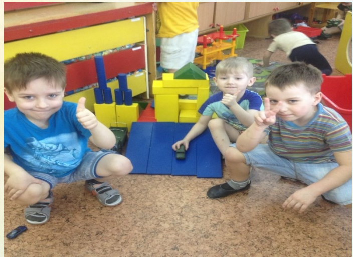
Полицейский в гостях у детей