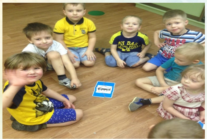
Дидактическая игра «Собери дорожный знак»