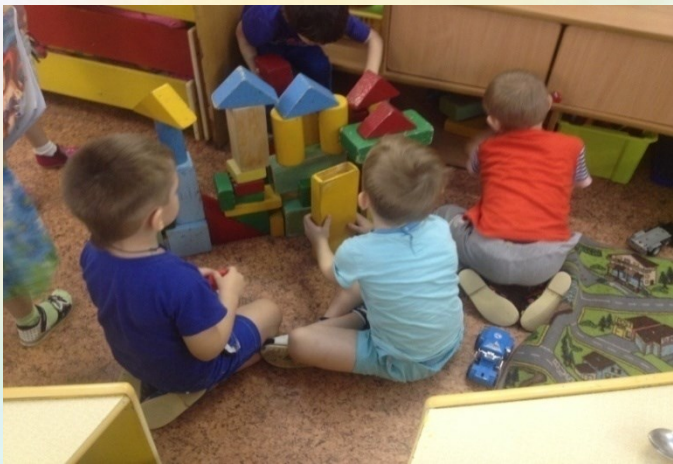
Строительная игра «Детский сад на нашей улице»