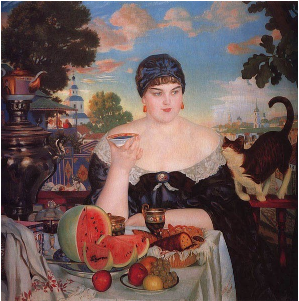
Б. Кустодиев. «Купчиха за чаем»

Запрет третий – на холодный чай. В то время, как теплый и горячий чай придают бодрость, делают ясным сознание и зрение, холодный чай дает побочные эффекты: застой холода и скопление мокроты.