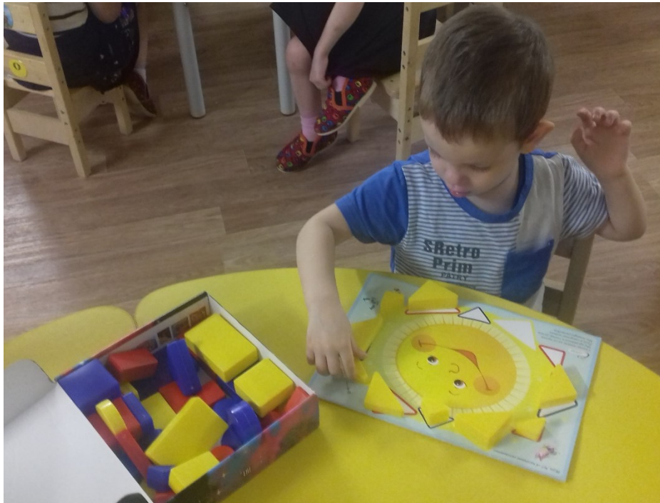
Индивидуальная работа на закрепление цвета «Блоки Дьенеша»