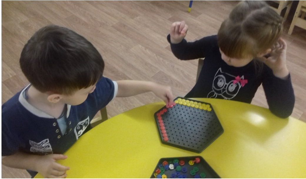
Выложи дорожки разного цвета