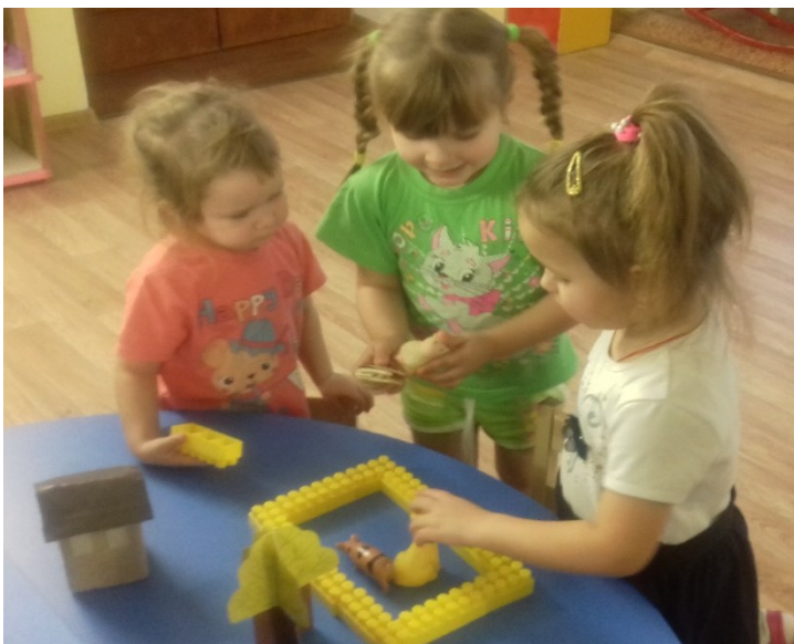
Конструирование «Загон для домашних животных»