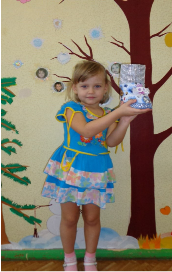
Башмачок семьи Смирновых