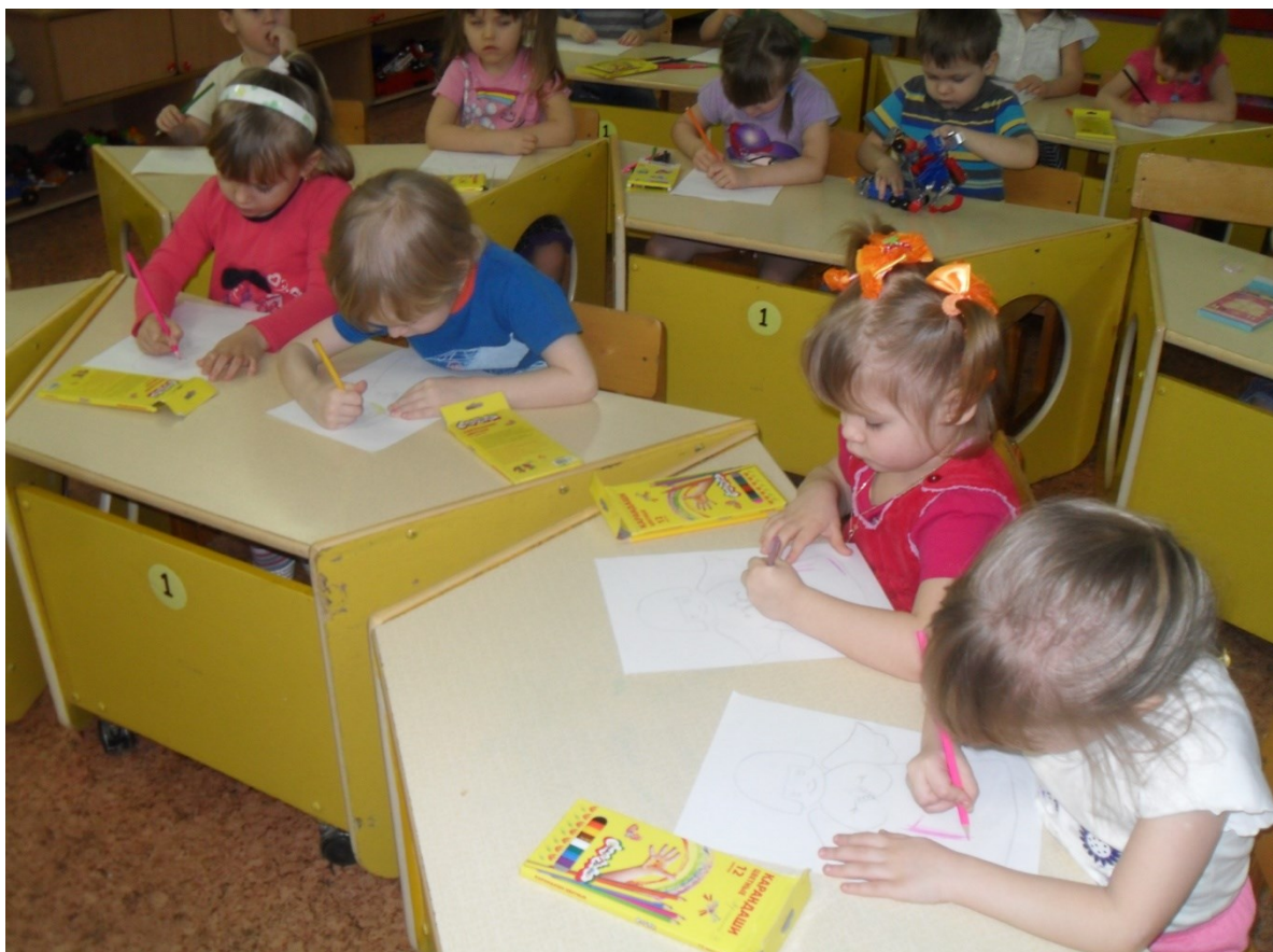
Самостоятельное рисование детей " Рисуем ангела"