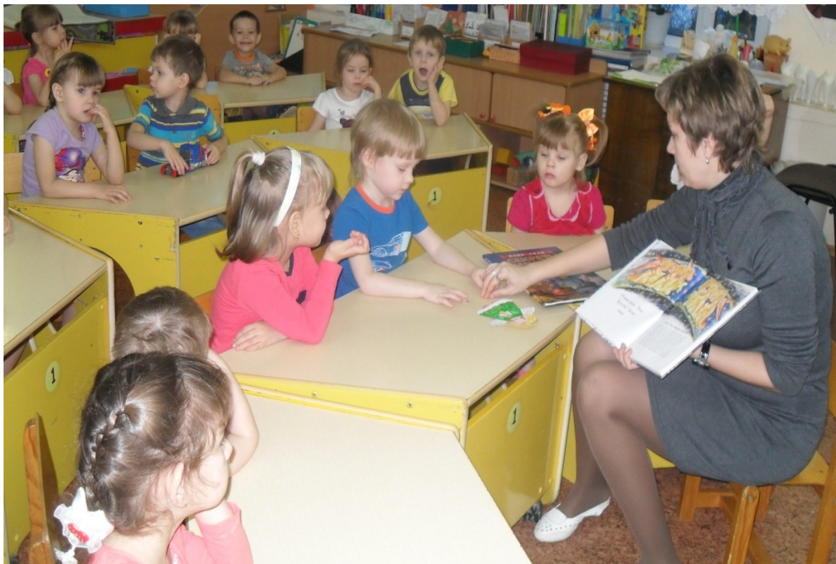
Беседа с детьми на тему " Что за праздник Рождество?"