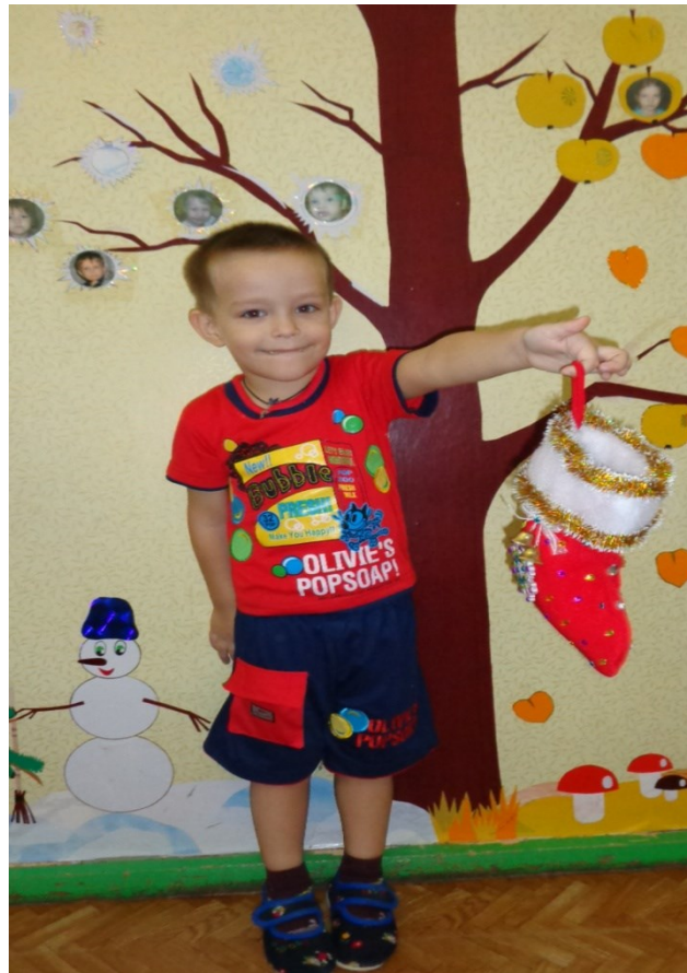
Башмачок семьи Заикиных