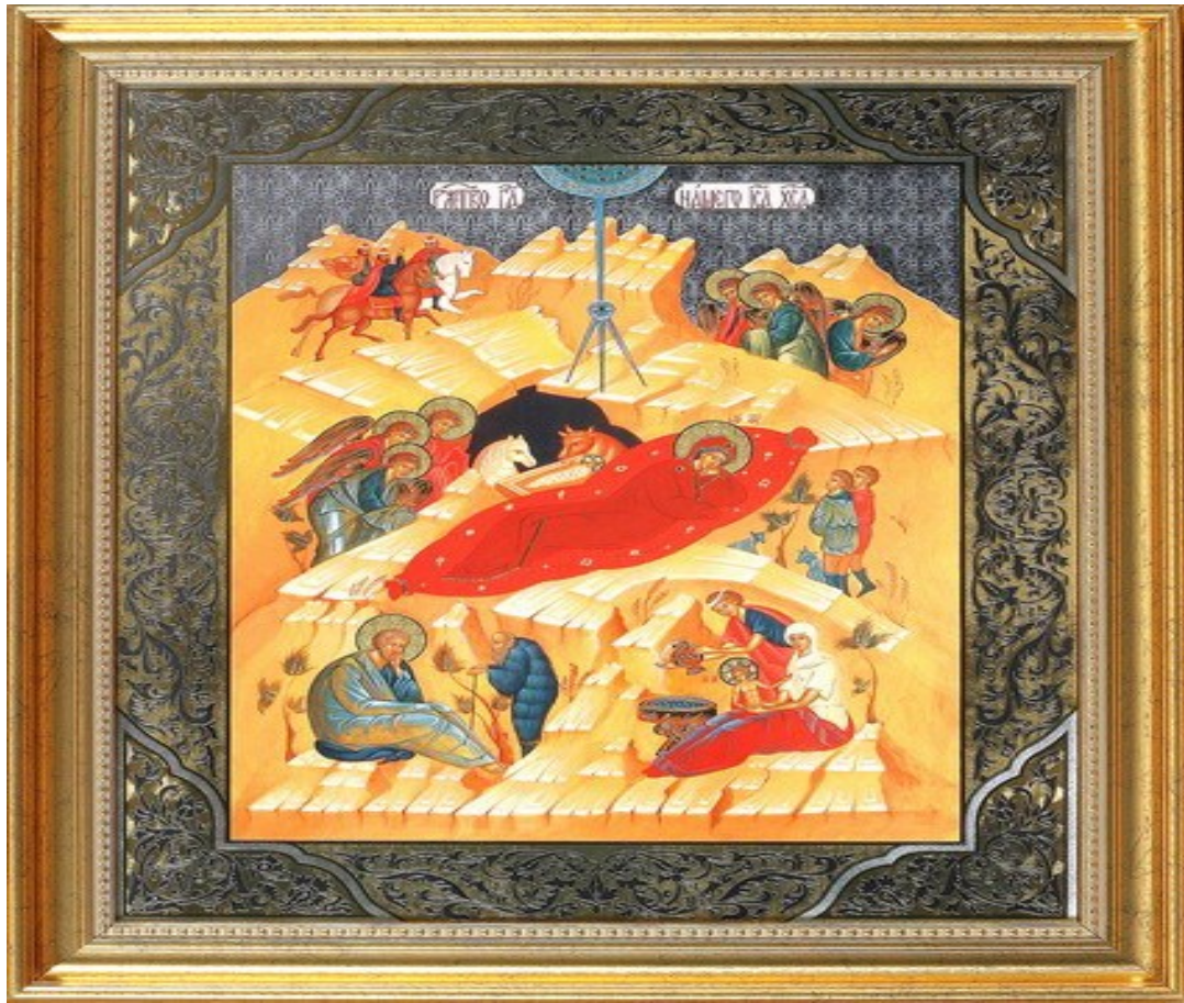
Репродукция иконы Рождества Христова