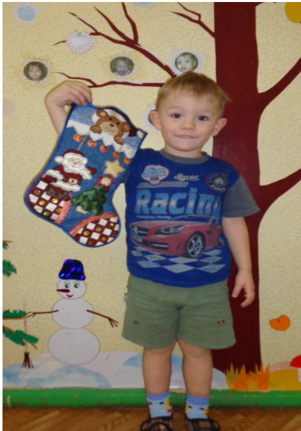
Башмачок семьи Старцевых