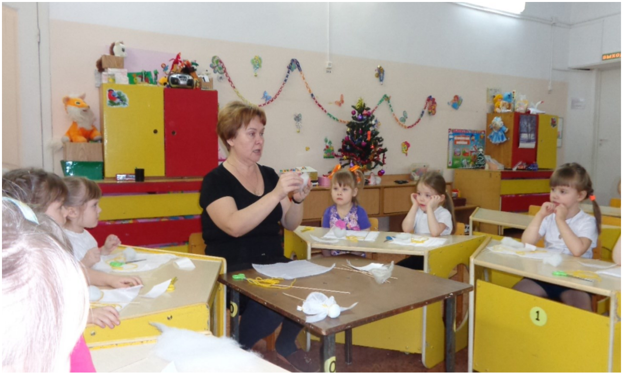
Конструирование "Ангелочки " (изготовление сувениров)