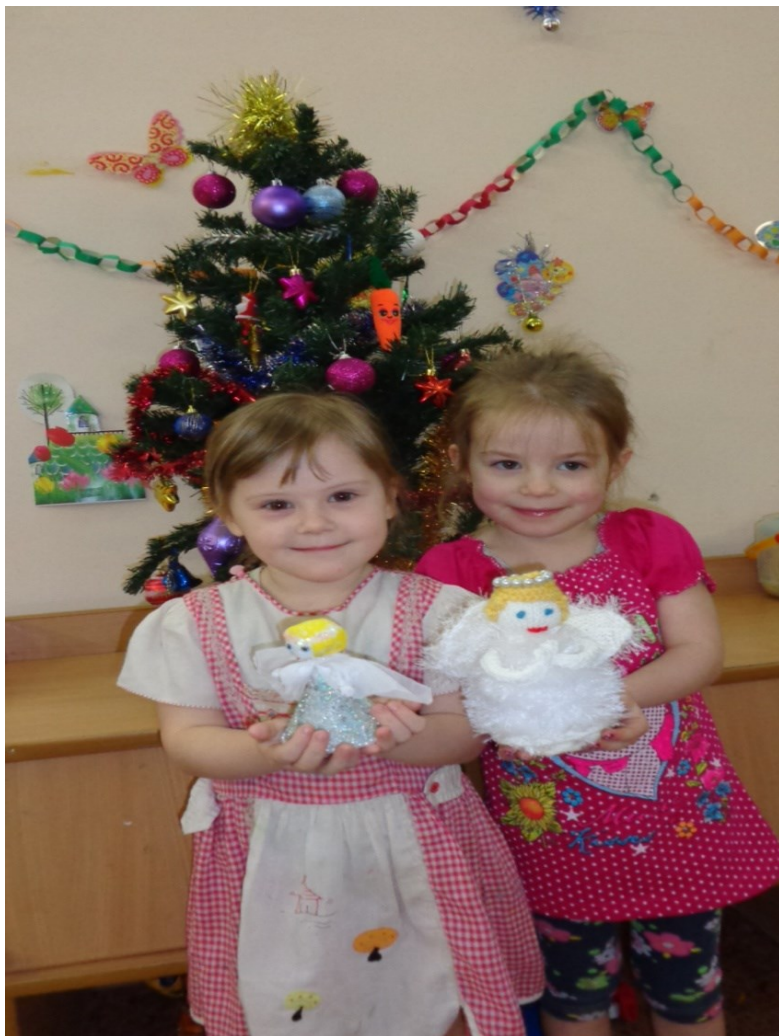
Театральный этюд "Семья справляет рождество"