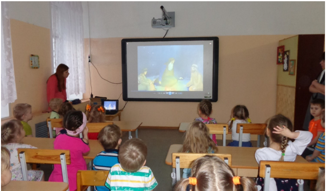
Просмотр мультфильма "Рождество Христово"