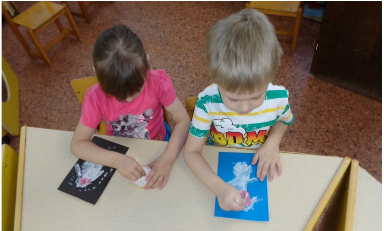
Рисование с использованием нетрадиционной техники «Рождественский ангелочек»